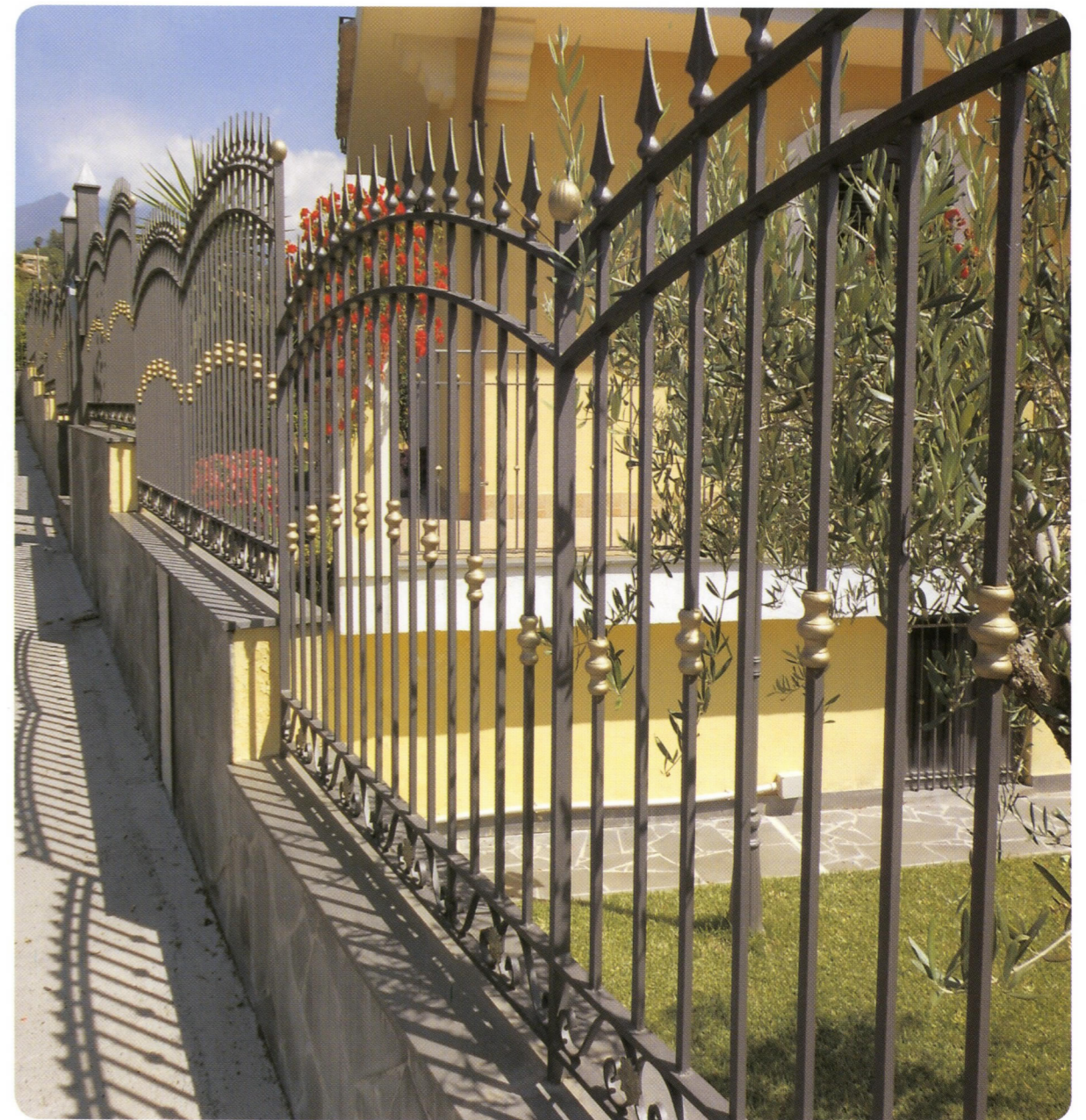
◆ Tinte Forti