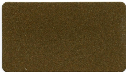
06 - Rame