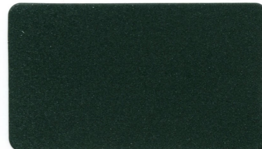
11 - Verde

Sovraverniciato con TRASPARENTE PROTETTIVO