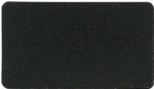
05 - Grigio Nero