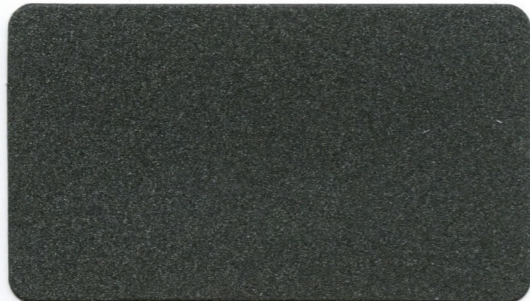
04 - Grigio Scuro