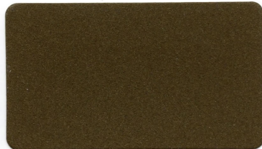
08 - Bronzo