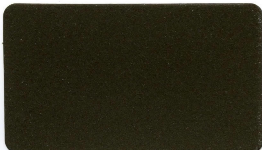
09 - Testa di Moro