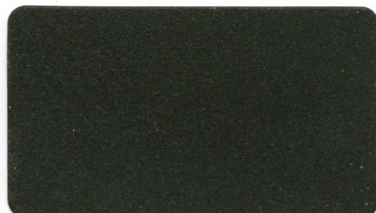
10 - Grigio Lavico