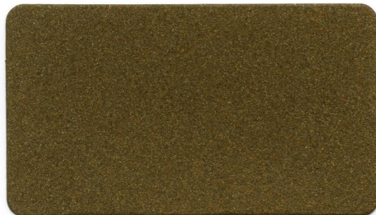
07 - Bronzo Chiaro