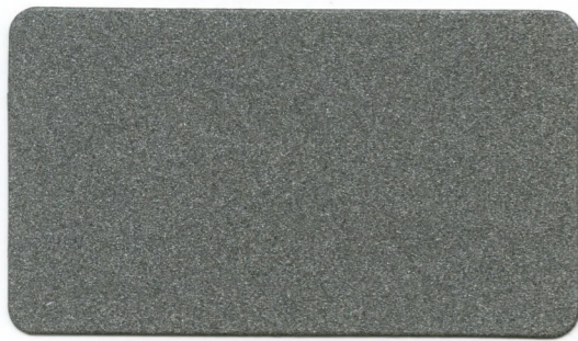
01 - Grigio Argento