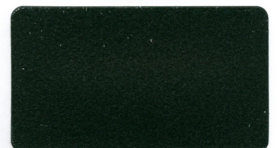
11 - Verde