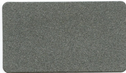
02 - Grigio Chiaro